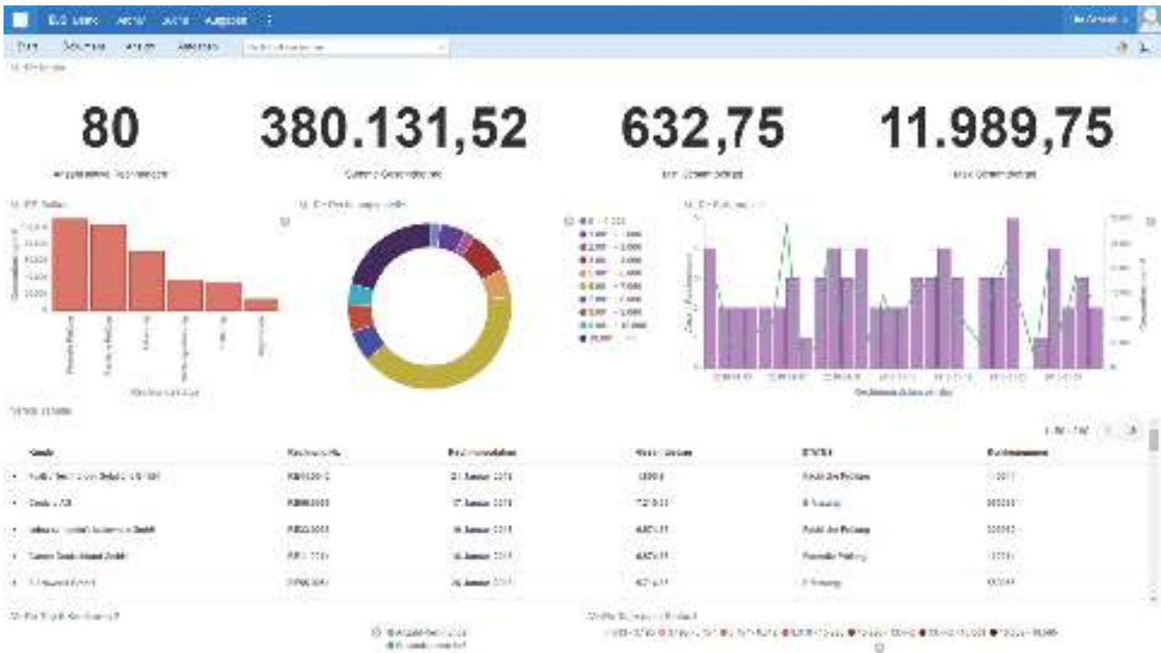
Abbildung zeigt: Übersichtliche Dashboards veranschaulichen komplexe Zusammenhänge