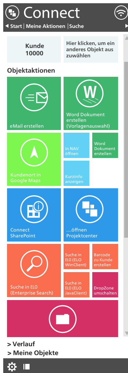
Abbildung zeigt: ELO Business Connect Sidebar mit Anzeige von Informationen und Aktionen zu einem konkreten Geschäftsobjekt.